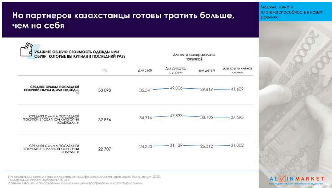
Слайд из презентации выступления Натальи Оспановой. На партнеров казахстанцы готовы тратить больше, чем на себя

В то же время, казахстанцы в своих покупках демонстрируют щедрость и в первую очередь покупают обновки близким или гостю, а уж только потом покупают себе. Они готовы отказывать себе и больше совершать покупок в пользу близких: «На своих партнеров и гостей казахстанцы готовы без оглядки тратить гораздо больше, чем на себя. Это касается не только супругов, но также детей и других членов семьи. На себе мы немного экономим, на любимых членах семьи – нет», - делится Наталья Оспанова.